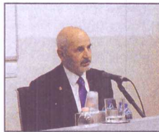
Liliana Segre Daniele Olschki

alla Casa Editrice di denunciare tra collaboratori e autori quanti appartengono alla razza ebraica. Una violazione della libertà di informazione, senza dare una risposta al perché. Una storia che si svolge ai margini di una più terribile tragedia di morti e deportazioni. Il