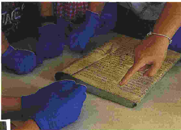
I ragazzi all'Archivio storico comunale di Imola esaminano i documenti, settembre 2019

La ricerca è partita dallo studio di frammenti di manoscritti ebraici medievali del XIII e XIV secolo, conservati nell'Archivio Diocesano e Archivio storico comunale di Imola, recuperati da rilegature di registri notarili. Nonostante il lungo periodo di didattica a distanza sono riusciti a completare lo studio delle Bibbia Ebraica miniata di Imola conservata presso la Biblioteca Comunale (MS. N. 77) e l'analisi e traduzione in chiave digitale della pubblicazione di Andrea Ferri e Mario Giberti La comunità ebraica di Imola dal XIV al XVI secolo (Olschki Editore, 2006).